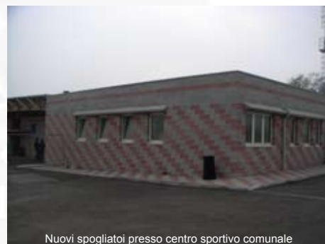
Nuovi spogliatoi presso centro sportivo comunale

I lavori sono in corso di ultimazione con un accordo di Programma tra i Comuni di Credaro, Castelli Calepio e Provincia di Bergamo.