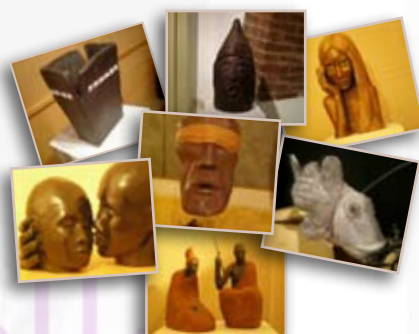
immagini tratte dal video "2008: Arteincastello", ideato e realizzato dall'artista Cristian Toresini

Truccabimbi e altri appuntamenti per grandi e piccini