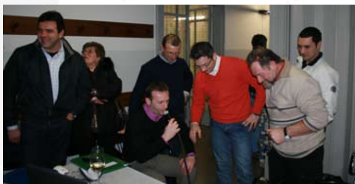
Nella foto alcuni donatori che si sono sottoposti al test dell'etilometro

Dall'inizio dell'anno, l'Avis di Castelli Calepio ha un proprio sito internet visitabile all'indirizzo: www.aviscastellilepio.org