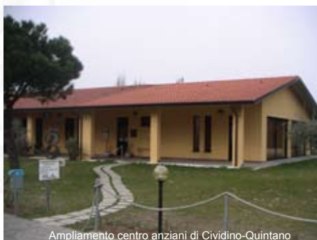
Ampliamento centro anziani di Cividino-Quintano

Per il secondo intervento (la piazza) si ritiene opportuno realizzare prima la variante alla S.P. 91,