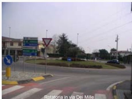
Rotatoria in via Dei Mille