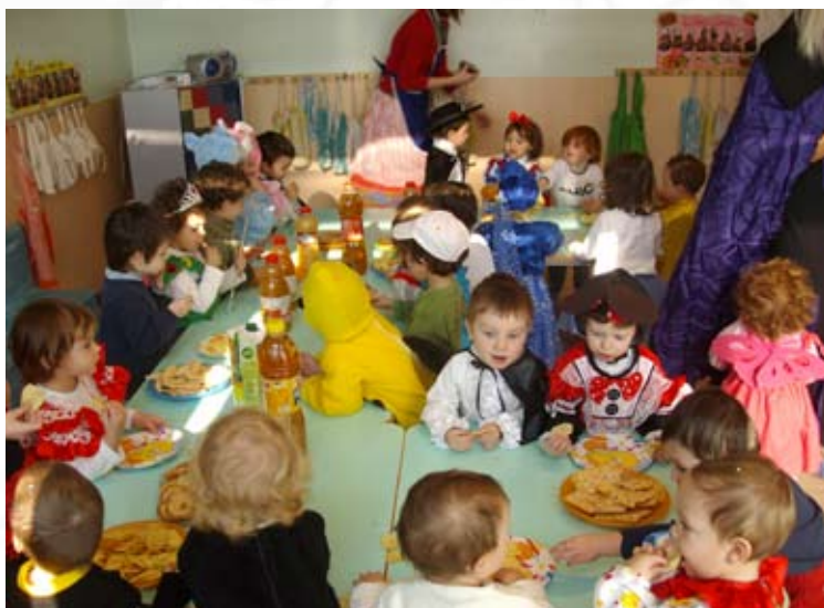
Asilo Nido “Il Paese dei Balocchi” (Cividino)

atto dal ministro Gelmini, che se pur doverose in funzione di un ammodernamento e di una razionalizzazione delle risorse, stanno cambiando in modo radicale la gestione della Scuola. La collaborazione tra Istituto Comprensivo, Amministrazione Comunale e Genitori è fondamentale per cogliere al meglio le opportunità di sviluppo del comparto scuola. Da parte nostra ci siamo attivati perché si possa concretizzare a breve la realizzazione del nuovo plesso scolastico di Tagliuno, finanziando la costruzione nel bilancio 2010 con l’individuazione dell’area (zona Via Locatelli/Aldo Moro) nel Piano del Governo del Territorio che presenteremo a maggio 2009.