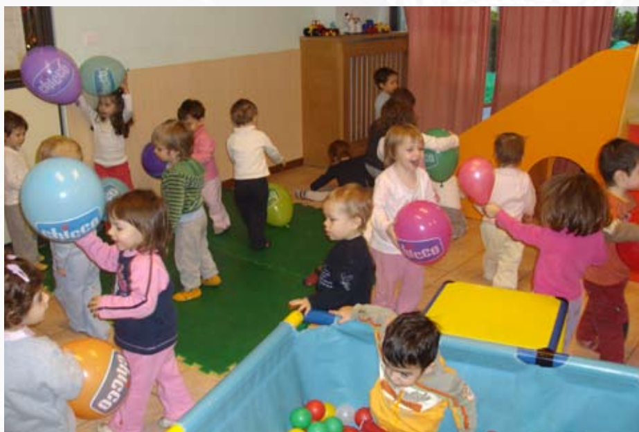
Asilo Nido "Il Paese dei Balocchi" (Cividino)

l'ingresso dell'anziano in strutture di ricovero tradizionale è dovuto proprio a problemi connessi con l'abitazione, oltre che a problematiche di ordine economico, sociale, di salute. Di conseguenza, sono necessari, oltre a servizi sociali, case dotate di attrezzature e progettate con alcuni accorgimenti, tali da renderle facilmente usufruibili e da ridurre al minimo la dipendenza dell'anziano. Intesi come un residence, gli alloggi protetti offriranno un contesto di vita normale e confortevole con una dotazione di strumenti e dispositivi, rivolti sia alla persona che alla sua abitazione, atti a diminuire lo stato di ansia e di disagio, causato dalla paura della solitudine e di sentirsi male senza avere la certezza di un soccorso immediato e valido. E' provato che la possibilità di avere contatti con vicini, amici, parenti, conoscenti, diminuisce il senso di solitudine e conferisce la sicurezza di poter essere assistiti in caso di necessità.