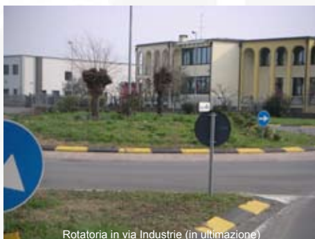
Rotatoria in via Industrie (in ultimazione)

Sono inoltre in corso di ultimazione i lavori dell'ultimo tratto di via XI Febbraio e dei semafori sulle vie dei Mille, Provinciale Valle Calepio, Locatelli e A. Moro.