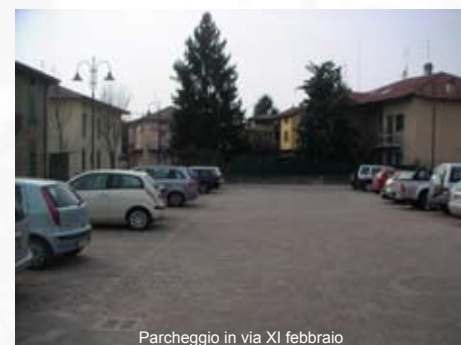
Parcheggio in via XI febbraio

Purtroppo in questi giorni siamo venuti a conoscenza che la Società,