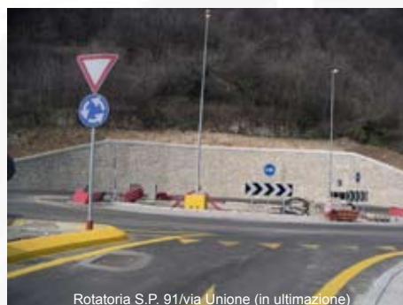
Rotatoria S.P. 91/via Unione (in ultimazione)

In diverse zone del Comune sono stati realizzati nuovi tratti di mar-