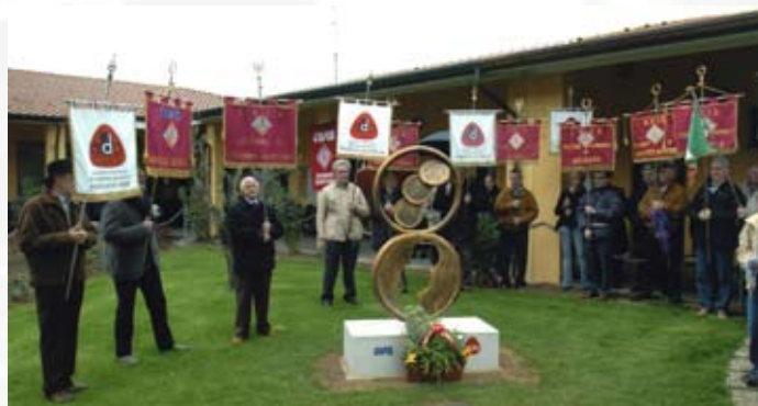
Avis Aido - Inaugurazione monumento a Cividino

Pescatori Valcalepio - Questo Gruppo è molto attivo non per le loro iniziative ma soprattutto per la