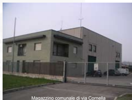
Magazzino comunale di via Cornella

do ai mutui, che stiamo indebitando troppo il Comune.