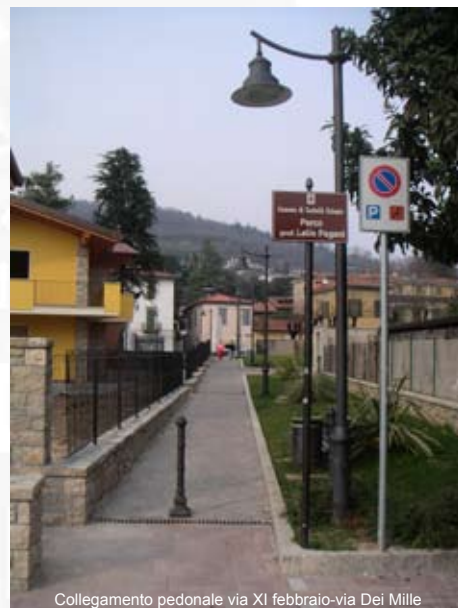
Collegamento pedonale via XI febbraio-via Dei Mille

Come già accennato, nelle prossime settimane inizieranno diverse opere stradali